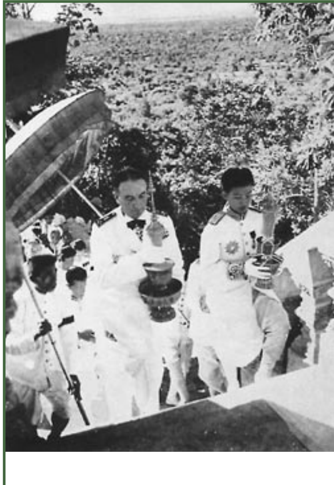
Funérailles du roi du Cambodge le 2 septembre 1941 : l'amiral Decoux porte l'urne funéraire au côté de S. M. Norodom Sihanouk.

Boileau disait : «Qu'est ce qu'une idée neuve ? C'est une idée que tout le monde a eue et que quelqu'un s'avise pour la première fois d'exprimer». Pour commenter les œuvres du Maréchal, les formules classiques viennent d'elles-mêmes aux lèvres. Le Maréchal est à ce point français qu'on dirait que chacune de ses pensées résume celles que vingt générations de Français ont essayé de concrétiser avant lui et qui aboutissent à l'expression pleine, simple et claire que la souveraineté de son esprit leur donne en les créant. C'est la France de toujours qui pense par lui.