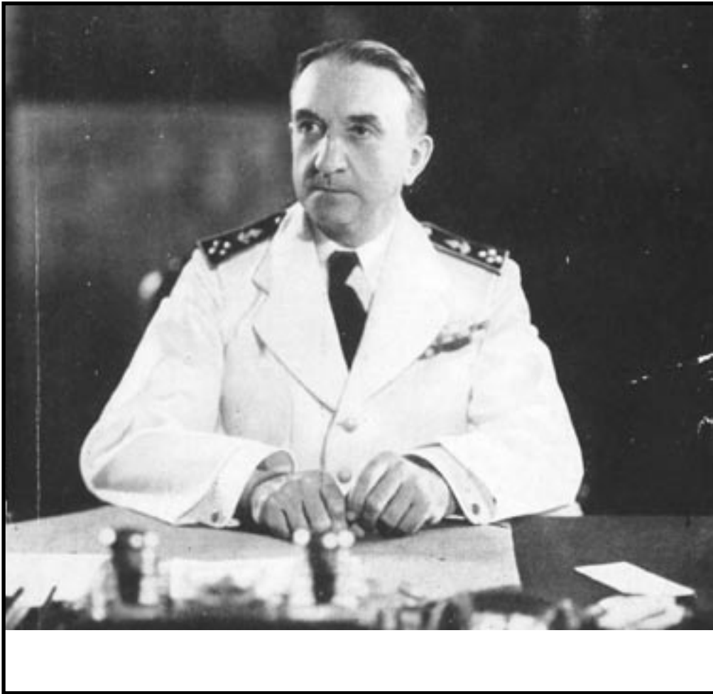
L'amiral Decoux à la barre de l'Indochine. Nommé en 1940, Gouverneur général par le chef de l'Etat français, il pourra dire en 1945 : "J'ai maintenu". Face aux Japonais et malgré les Alliés.

Franchissez 23 ans : Juin 1940. La France battue. L'armée prisonnière ou en morceaux. Les transports détruits. Les usines stoppées. Le peuple en déroute sur les grands chemins. Le Gouvernement liquéfié. La Chambre, le Sénat, les Ministres, le Président de la République demandant au Maréchal Pétain de prendre le Gouvernement parce que - raison stupéfiante dans leur bouche - il est pur de toute politique. Devant lui de Genève à Tours et à Hendaye cent cinquante divisions allemandes ; du lac de Genève à Menton, dans le flanc, le poignard italien ; autour de lui d'un côté nos hommes politiques qui, après ce sursaut venu d'un tréfond patriotique qu'ils ne soupçonnaient pas à eux-mêmes, sont déjà revenus à leurs manœuvres coutumières, — dans ce métier qu'est la politique, quand tout est perdu il reste encore le bluff et la réclame — calculent : «Le vainqueur de Verdun, quelle publicité ! L'emmener en Afrique, le brandir en drapeau pour couvrir nos hontes et, quand il nous aura servi, l'envoyer comme un autre général Boulanger se suicider à Tombouctou sur la tombe de ses déceptions, quelle combine !».