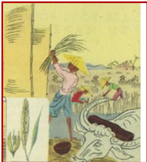
Les bons points du Maréchal

Au rapport le Général écoutait immobile. Comme un musicien décèle dans un son la