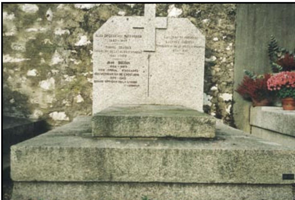
La tombe de l'amiral Decoux au cimetière de Loverchy, à Annecy.