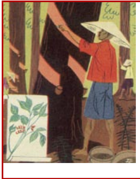
Les bons points du Maréchal

Travaux dans les rizières d'Indochine. La politique du retour à la terre.