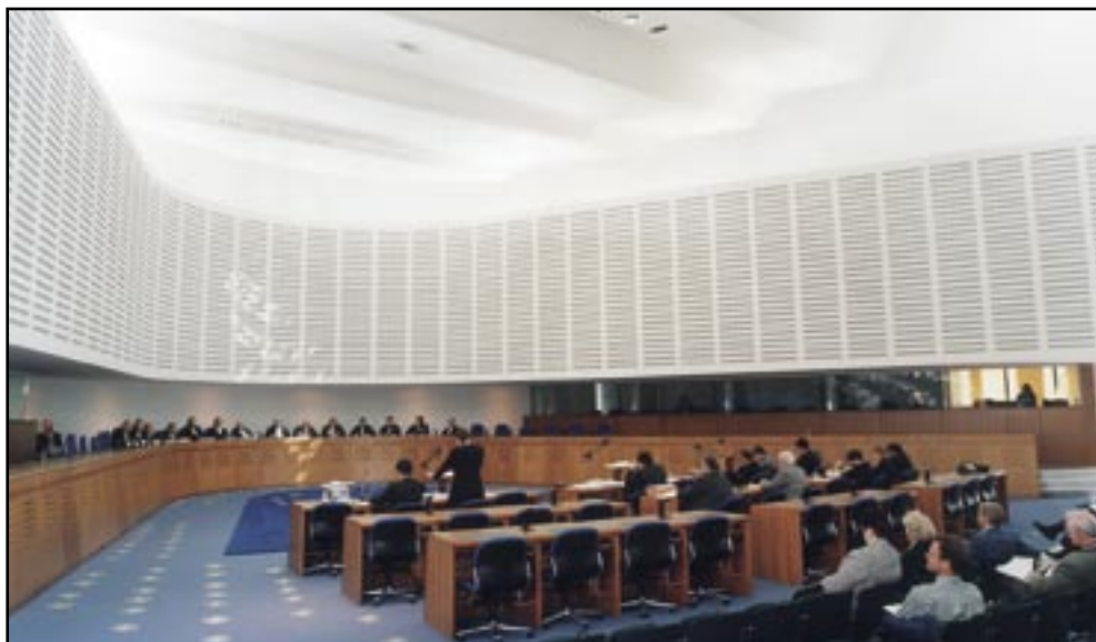
Conseil de l'Europe

Audience devant les juges de la Cour européenne des Droits de l'Homme à Strasbourg, réunis en Petite Chambre.