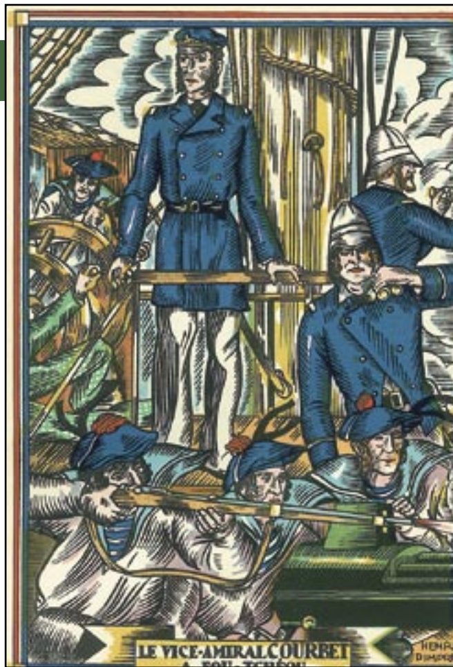
L'amiral Courbet représenté durant le bombardement du port de Fou-Tchéou (face à Formose), en 1884. La Chine abandonna ses prétentions sur le Tonkin et l'Annam.

Le commandement thaïlandais avait le sien (1) qu'il n'osait pas appliquer tandis que l'état-major français soumit à l'amiral Decoux deux plans de campagne : l'un défensif, —mais comment protéger 1 800 km de frontières avec si peu de moyens ? —, (voir tableau des forces en présence ), l'autre