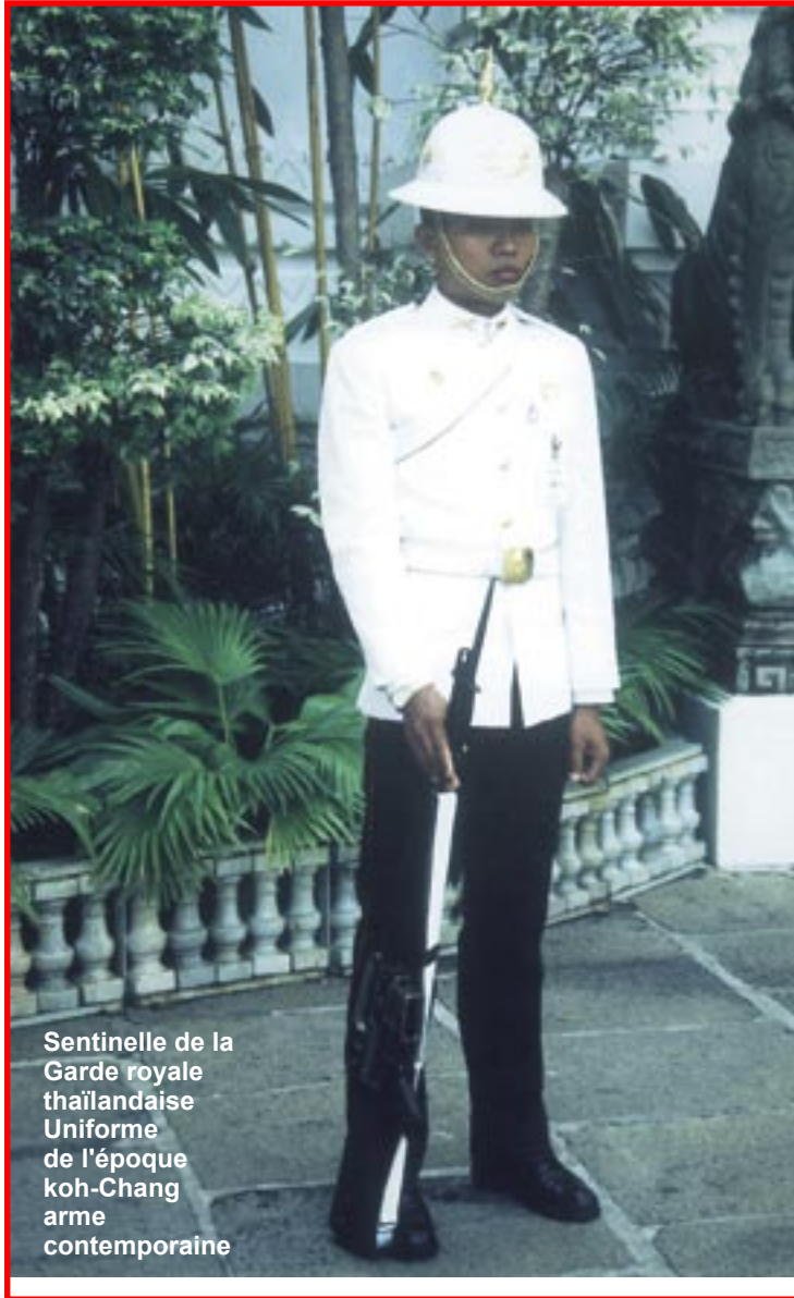
Sentinelle de la Garde royale thaïlandaise Uniforme de l'époque koh-Chang arme contemporaine

Il y a 60 ans, avec panache et discipline, l'armée française d'Indochine résistait à l'envahisseur siamois et la marine écrivait à Koh-Chang l'une des plus belles pages de son histoire.