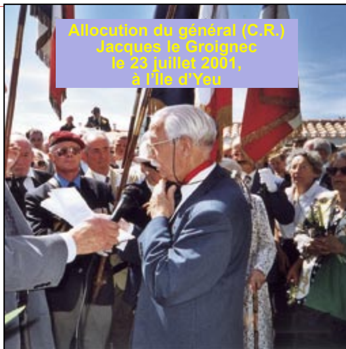
Au pied de la tombe du Maréchal, notre président prononce son allocution d'une voix qui porte au-delà du cimetière.

Il n'y eut jamais, plus admirable évocation de l'âme du Français enra-