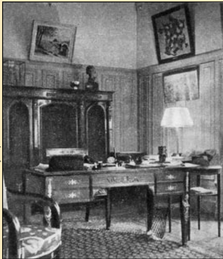
Dans un petit bureau d'angle, le chef de l'Etat travaille au milieu de quelques meubles de style empire. L'exemple de la modestie

Editions André Bonne Bureau de Documentation - Etat français