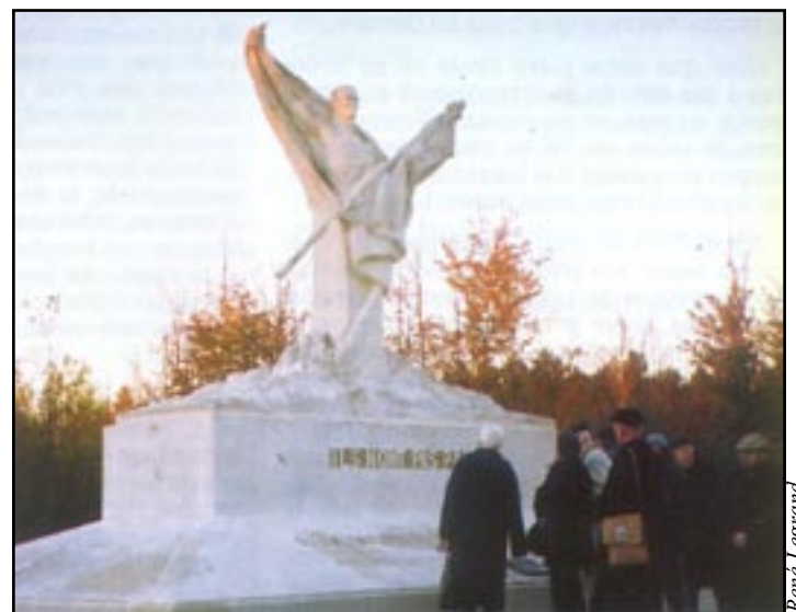
Le monument du Mort Homme. «Ils n'ont pas passé».

La Côte 304 et le Mort Homme constituaient les dernières étapes de notre périple à travers les champs de bataille. C'est de là que l'armée américaine partit le 26 septembre 1918, à l'attaque des hauteurs