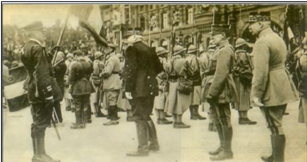
Le Deley - Paris

Les manifestants agressent et blessent un camelot isolé de l'Action française. Le courrier des lecteurs du «Figaro» du 5 mai 1997, dénoncera le fait qu'une église de France ait pu être fermée aux chrétiens.