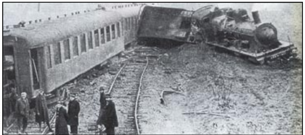
«Ah ! celui-là, ils ne l'ont pas loupé !». Il se trouvait des gogos qui éprouvaient une jouissance à la vue des destructions de notre potentiel économique.

de son comportement, «résistant» (ou soi-disant tel) ou «collabo» (ou réputé tel) comme si aucun autre souci n'existait, les problèmes matériels n'étant que vulgaire intendance, comme disait avec mépris le chef de la France dite libre. A tel point que pour l'opinion actuelle, le problème de la survie au quotidien de la France et des Français ne se posait pas.