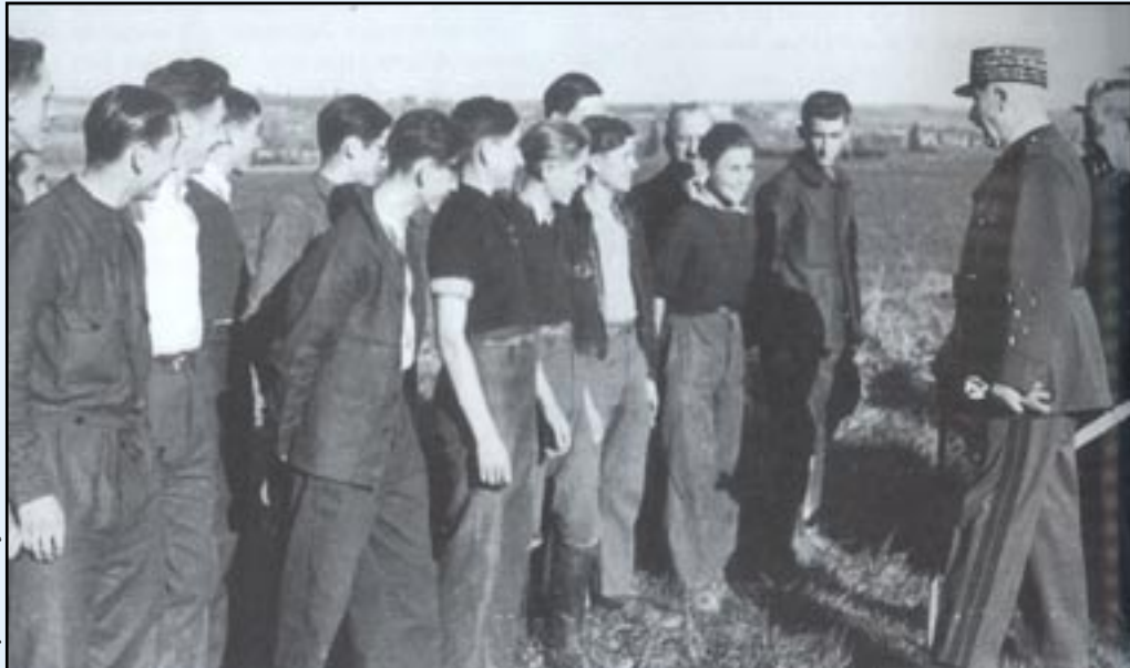
Entre Toulouse et Montauban, le Maréchal s'est arrêté dans une école d'agriculture. «La joie rend fort, le plaisir affaiblit.»

Et nous n'étions pas les seuls, nous étions nombreux à le vouloir. Que ce soit la J.F.O.M., que ce soit les Compagnons de France.