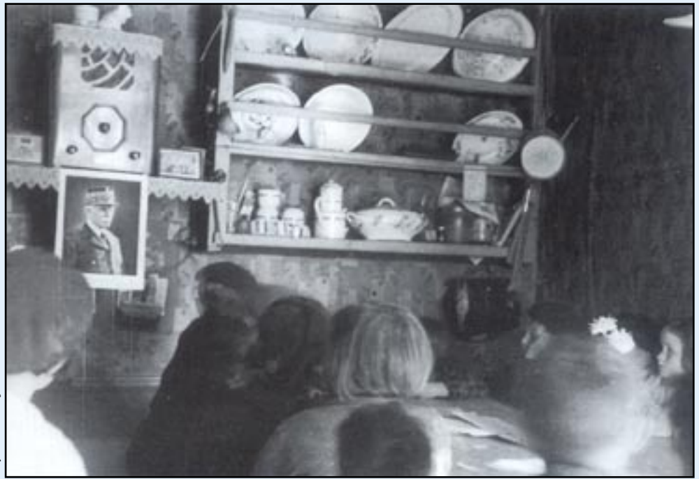
Le Maréchal s'adresse par la radio, aux enfants des écoles. Dans une ferme, garçons et filles sont venus l'écouter : « Cultivez en vous, le sens et l'amour de l'effort ».