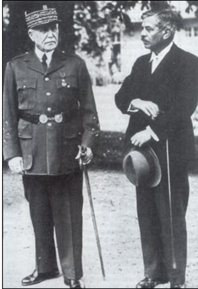
Quand il ne recourt pas à la fiction, le cinéma est bien impuissant à montrer le Maréchal et Pierre Laval comme les personnages d'un «duo infernal».

À la revue Enquête sur l'Histoire , Dufilho confiait pendant le tournage : «De l'équipe du film, je suis le seul à avoir vécu cette époque. Ayant vu et entendu Pétain, j'essaie de m'en rapprocher le plus possible et d'éviter la caricature. En 1940, l'armistice