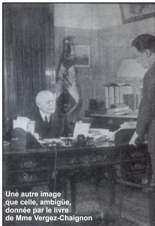
Une autre image que celle, ambiguë, donnée par le livre de Mme Vergez-Chaignon

(1) «Les caméras du diable», par Norbert Multeau. 261 pages, 23 euros. Editions Dualpha – Centre MBE 302 : 69, boulevard Saint-Marcel – 75013 Paris.