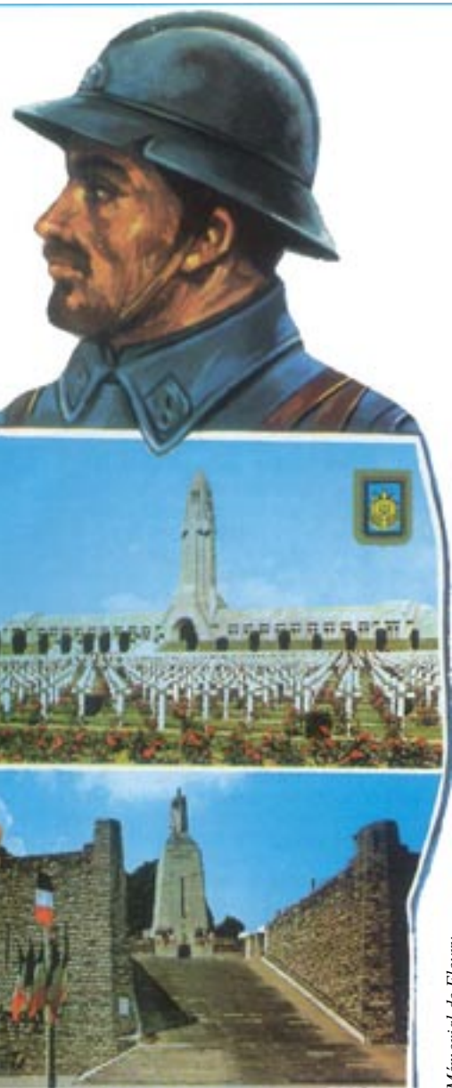
Mémorial de Fleury

Ces grands témoins ne sont plus, mais l'hommage qu'ils ont rendu à Pétain demeure. Il constitue de facto une réhabilitation totale de l'illustre soldat dont les adversaires avaient osé associer le nom à Hitler puis à Auschwitz, en oubliant Verdun, sa gloire et son sacrifice.