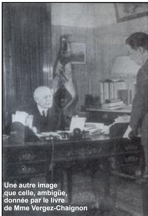
Bureau de Documentation du Maréchal