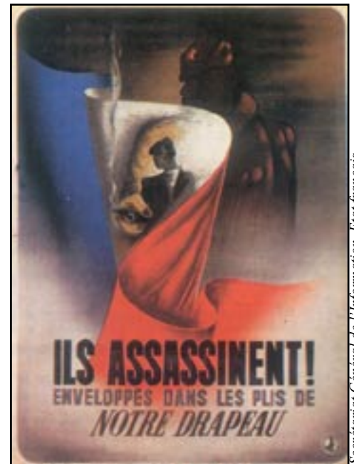
Secrétariat Général de l'Information. Etat français

Au lendemain de l'armistice de juin 1940, arrivant de Belgique où ils s'étaient réfugiés pendant la «drôle de guerre», les dirigeants du P.C.F. n'avaient-ils d'ailleurs pas été les premiers à chercher à collaborer avec les autorités d'occupation allemandes ?