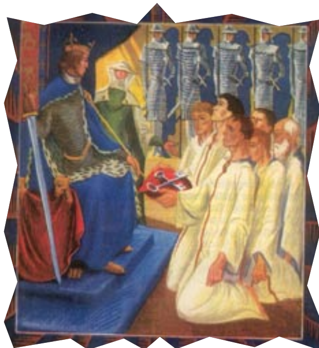
Dessin de Jean Chièze, 1942