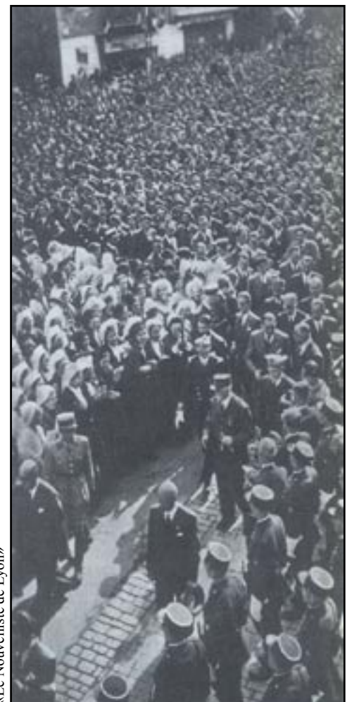
«Le Nouvelliste de Lyon»

(1) «Charles De Gaulle», par Eric Roussel. 1 030 pages, 30 euros. Gallimard.