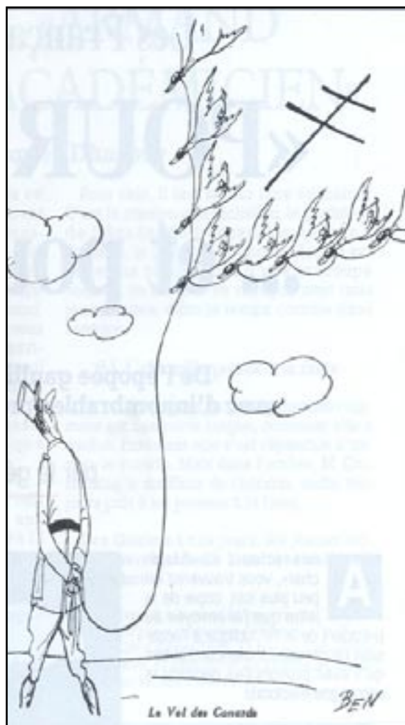
Le Vol des Canards. Dessin de BEN illustrant L'Histoire de la spoliation de la presse, par Claude Hisard.

❹ Politicien et orateur de génie, il se révèle un politicien machiavélique en voulant faire aboutir une cause qu'il confond avec sa propre fortune. Etant donné que la France c'est Lui, tout devient permis. Armé de son seul micro, il séduit le peuple français prisonnier en lui apportant des raisons d'espérer. Metteur en scène d'un scénario héroïque, appelant les enthousiastes, les héros, les poètes, à construire une commune légende afin de s'y admirer eux-mêmes, il est emporté par son éloquence et son ambition à tordre les faits, à mentir, à